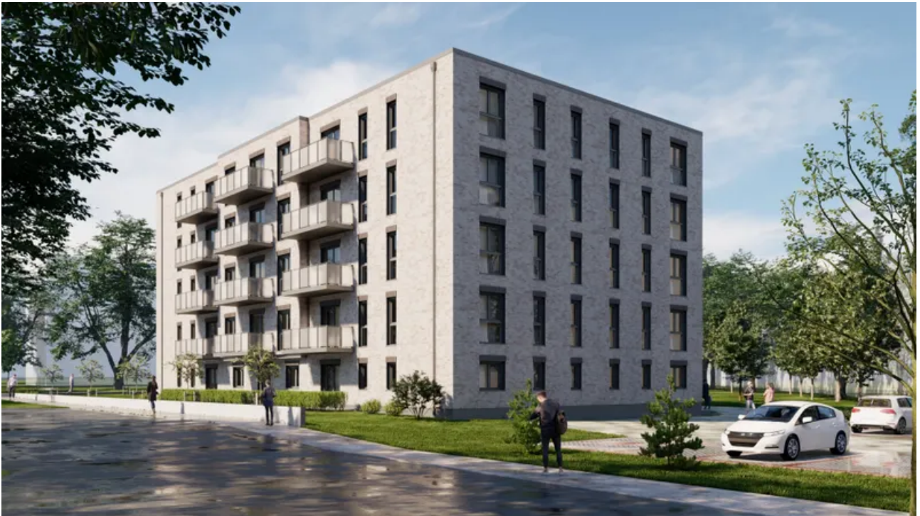
4K_03v_1 - Photo-min