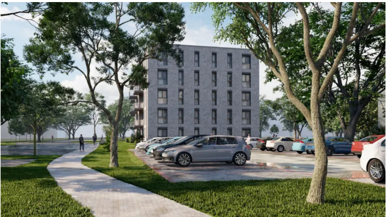
4K_03v_5 - Foto-min