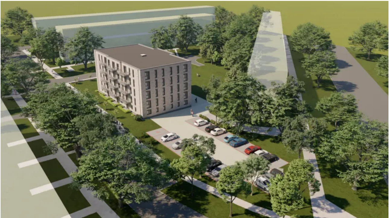
4K_03v_7 - Foto-min